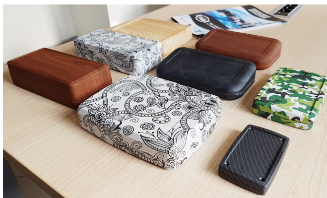
Fotografia 2. Wyjątkowe wykończenia obudów

Takie kompleksowe podejście do obudów jest wynikiem wielu lat współpracy z projektantami i producentami, dla których nowe rozwiązania, mające na celu wsparcie ich pracy, jest cenną zaletą, której poszukiwali na rynku. Kradex w swoich planach ma kolejne zestawy i akcesoria. Aktualna sytuacja rynkowa i nowe wyzwania, przed którymi stają firmy z branży, jeszcze nasilają wymóg takiego podejścia do produktów, na czym obecnie i w przyszłości będzie skupiać się Kradex.