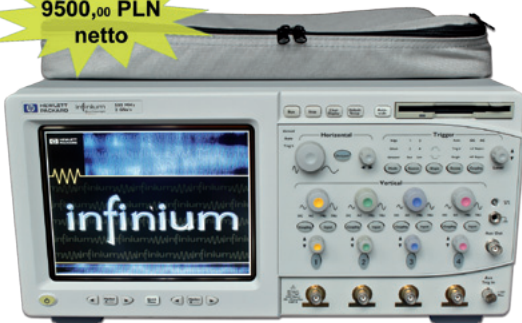
Agilent HP 54825A 2GS 500MHz

ATLANTEC Świeciechowa ul.E.Plater 36 tel. 661894829 www.atlantec.pl www.oscyloskop.eu